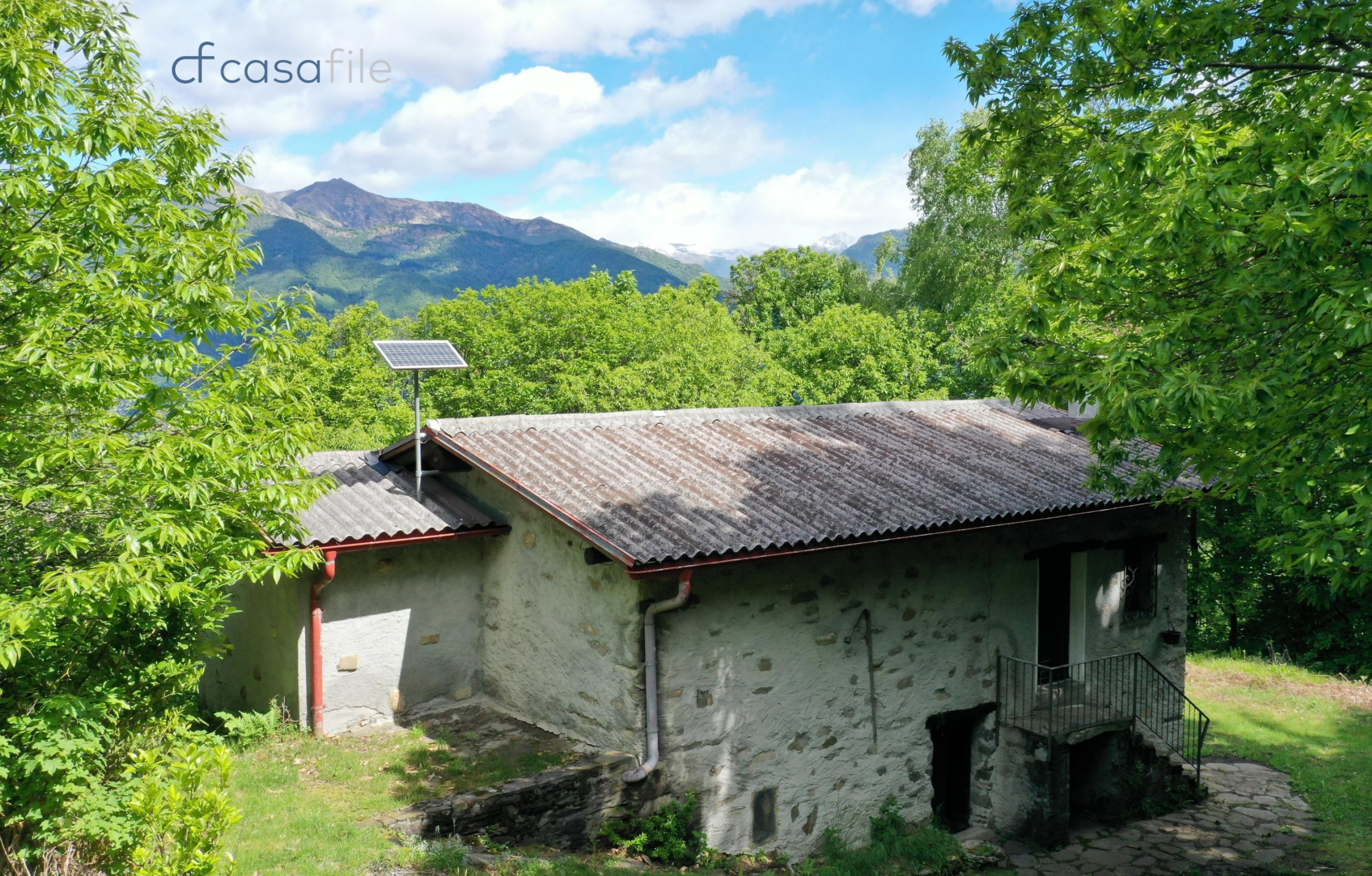
Rustikal ausgebautes Steinhaus umgeben von Natur Monti di Vairano, 6575 Vairano Gambarogno