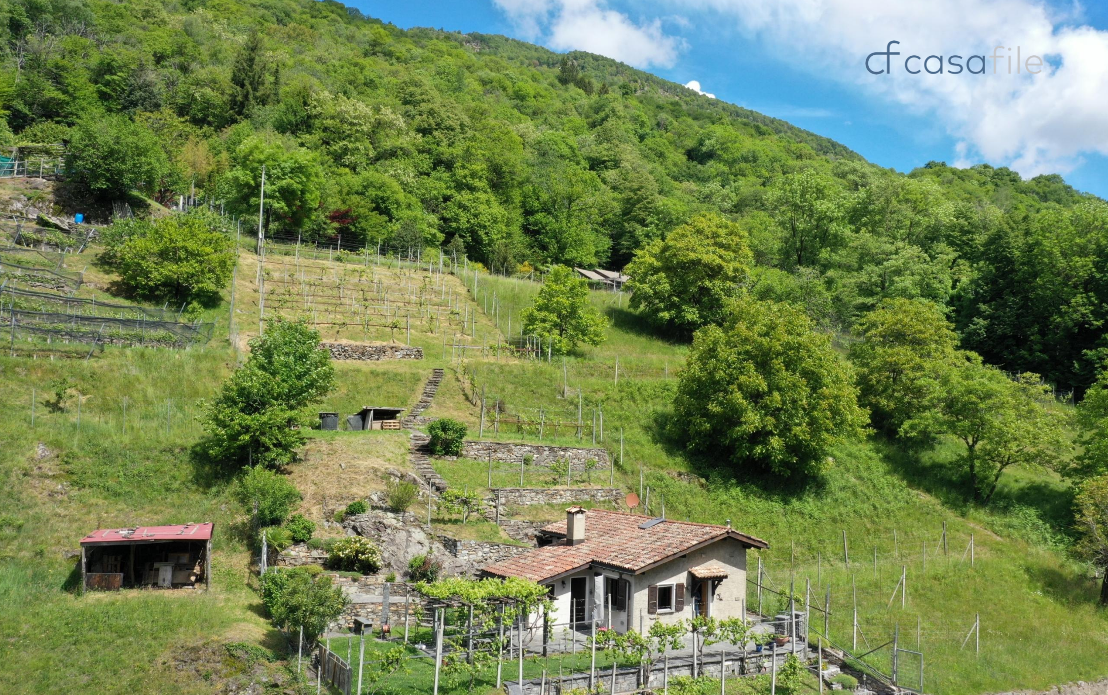
Sehr schönes Rustico in ruhiger Lage mit kleinem Rebberg Fontanelle 8, 6809 Medeglia