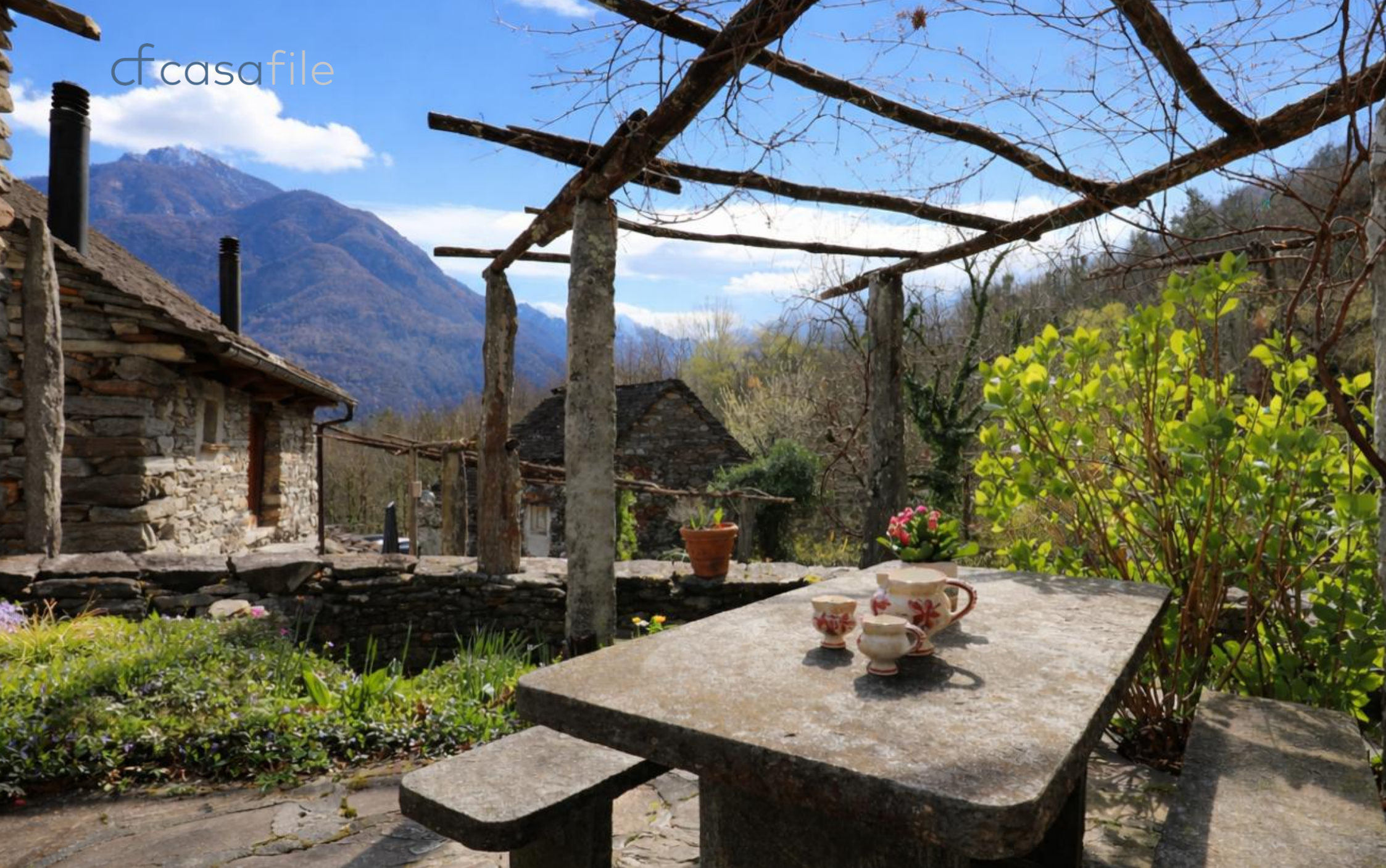
Sehr schönes Rustico mit Sicht auf die Berge im Maggiatal Al Tòrn 14, 6678 Lodano