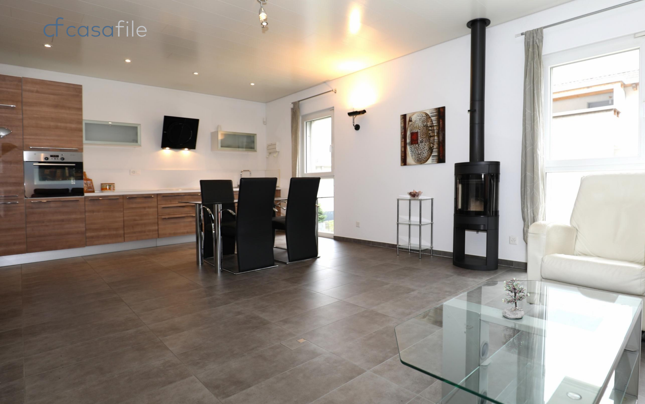
2-Zimmer-Eigentumswohnung in ruhiger Wohngegend Via Camp de la Mezzera 26, 6534 San Vittore (GR)