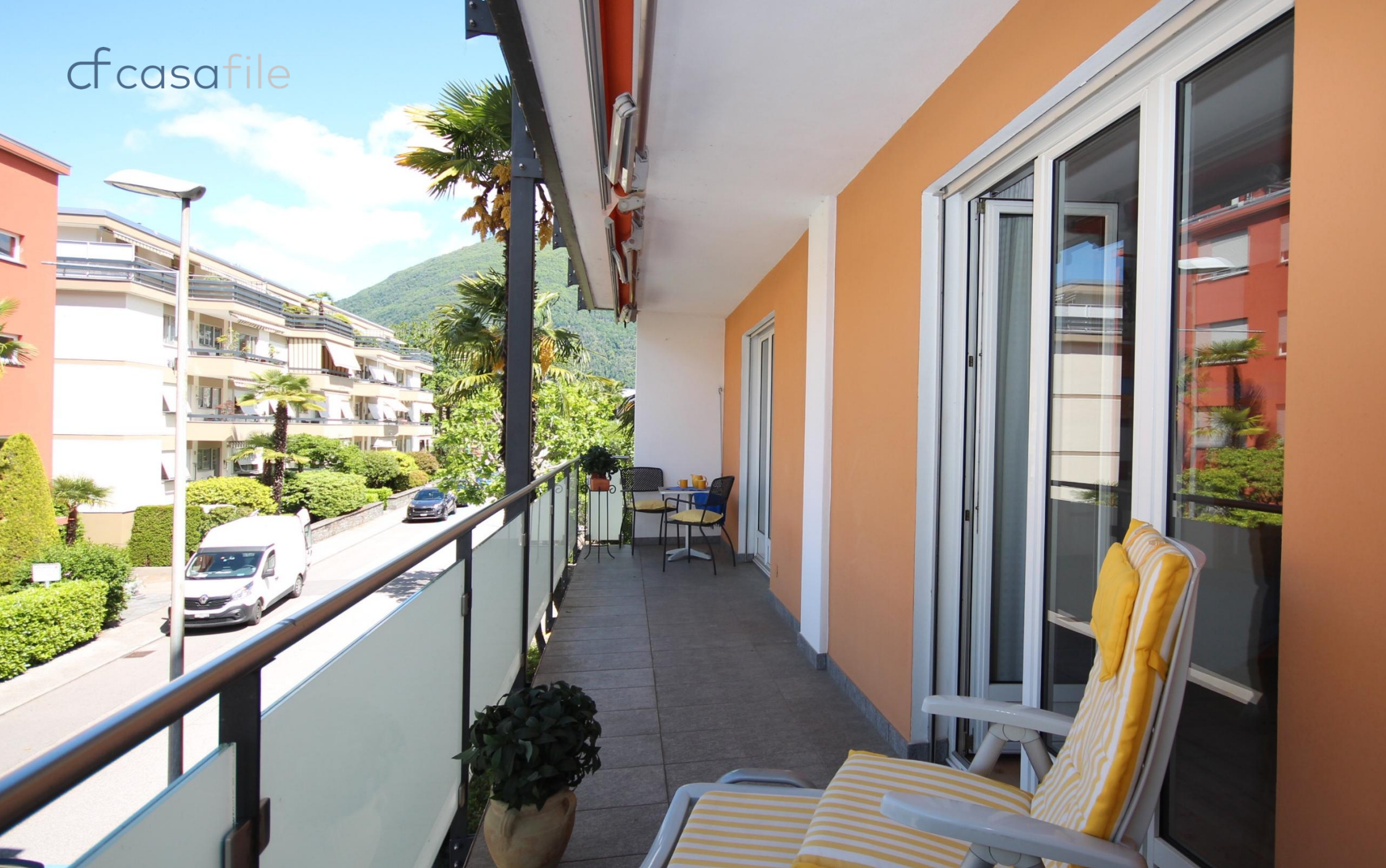
Gepflegte 2.5-Zimmer-Eigentumswohnung in bevorzugter Lage Via Architetto Pisoni 5, 6612 Ascona