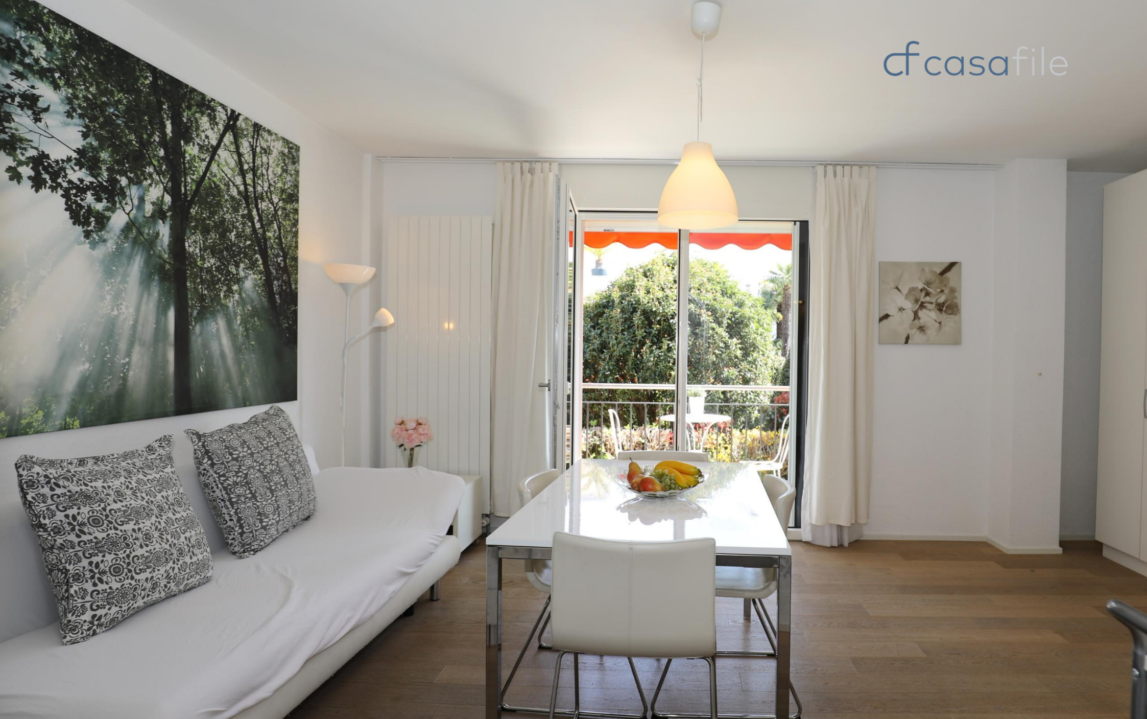
Moderne 2.5-Zimmer-Eigentumswohnung in bevorzugter Lage Via Architetto Pisoni 5, 6612 Ascona