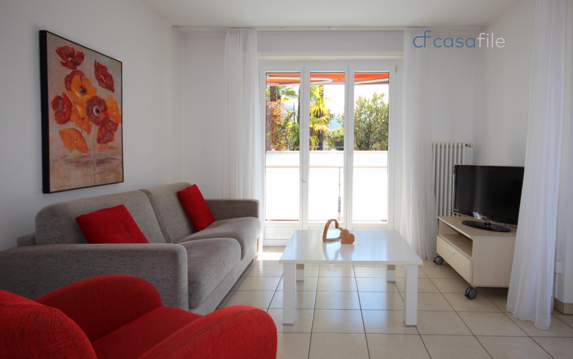
3.5-Zimmer Eigentumswohnung zentral gelegen in der Residenz Corallo Via Architetto Pisoni 5, 6612 Ascona