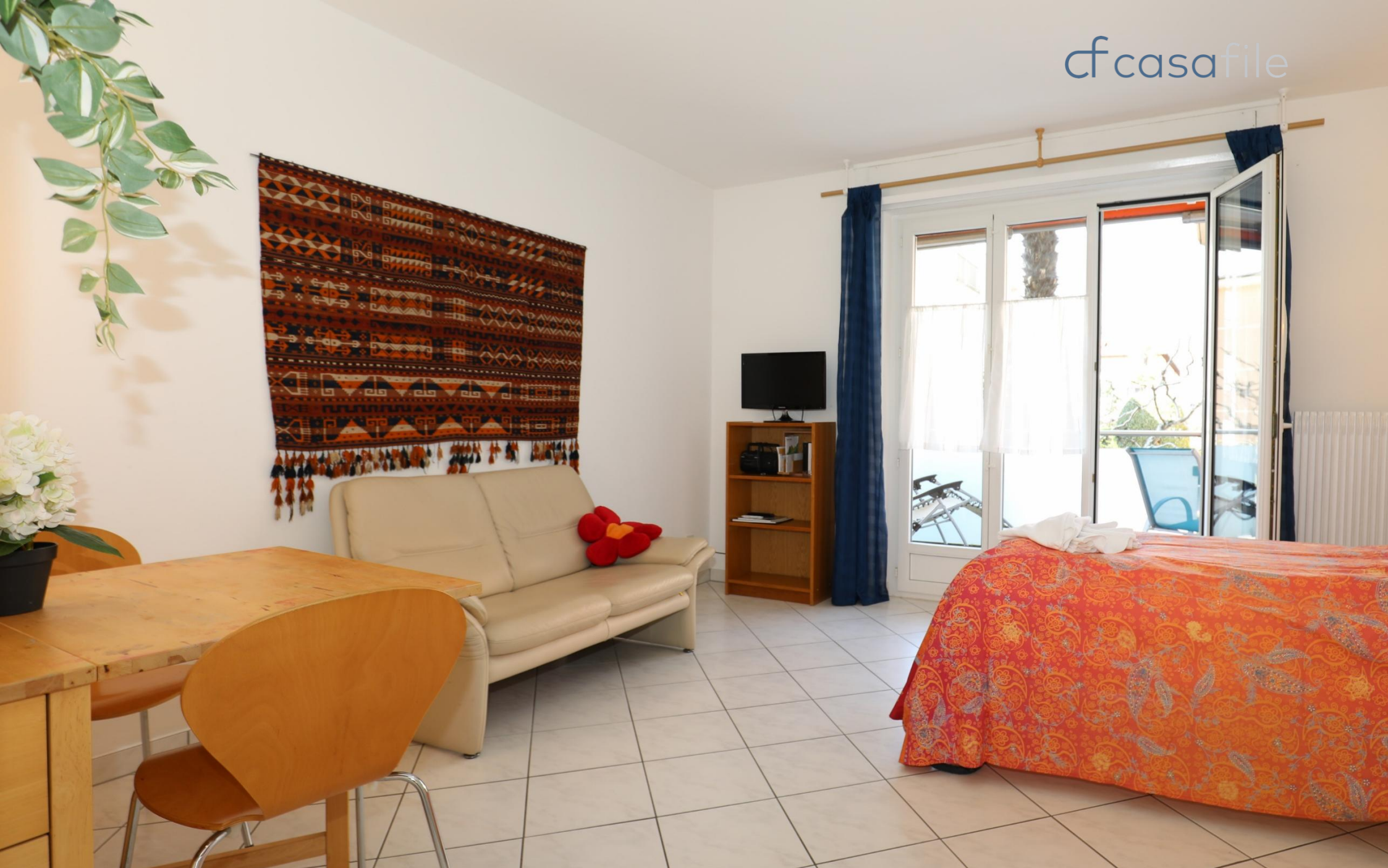
Studio-Eigentumswohnung in gepflegtem Quartier in bester Lage Via Architetto Pisoni 5, 6612 Ascona