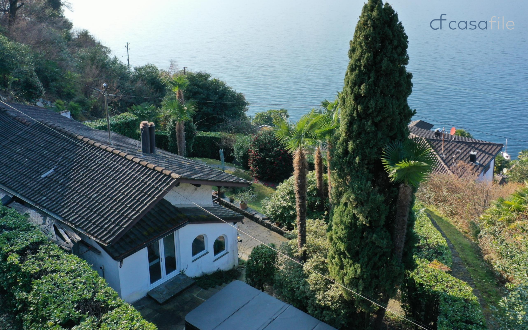
Charmantes Einfamilienhaus mit herrlicher Sicht auf den Lago Maggiore Sentiero Prestino 4, 6577 Ranzo- Gambarogno